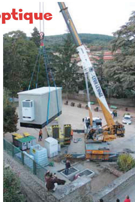
▲ Dépose du local technique (26 tonnes). ▼ Élargissement du lit de la rivière.

Nous informerons la population de la date exacte du début des travaux dans chaque rue.