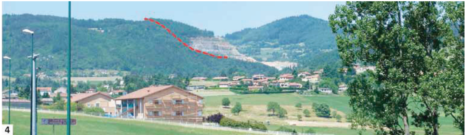
Photo extraite du dossier transmis par la préfecture de la Loire : étude paysagère Durand, page 17.

La procédure de transformation du POS en PLU se terminera fin 2016 ; elle ne prend pas en compte la demande d'extension car aucun dossier réglementaire ICPE (Installations Classées pour la Protection de l'Environnement) n'a été fourni aux élus.