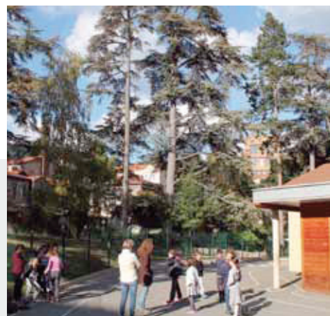
▲ Un cadre unique pour les TAP