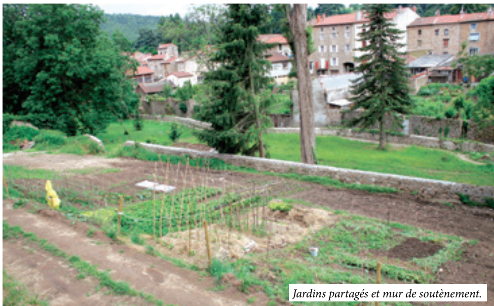
Jardins partagés et mur de soutènement.

– La démolition d'une maison montée Saint-Ennemond a été nécessaire car elle menaçait la sécurité des piétons. La décision a été prise par le tribunal administratif afin que la commune puisse la démolir. Nous sommes en cours d'identification de l'ensemble des propriétaires pour rétrocéder cette parcelle à notre commune. Dans le cas où un des propriétaires souhaiteraient conserver le terrain, il devra alors s'acquitter de la facture de démolition qui représente 3 600 €.