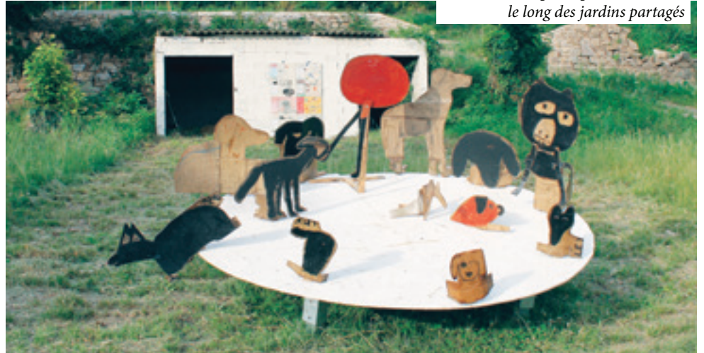
Les TAP : arts plastiques avec ENOS le long des jardins partagés

Pour la prochaine année scolaire, la décision a été prise de maintenir les horaires