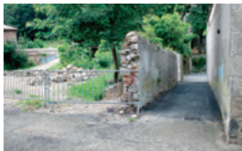
Goudronnage rue des Célibataires.

– La rue du Plateau Marchand , la rue Pré-Martin , la Pourretière et également la petite rue (nouvellement baptisée rue des Célibataires ) derrière la mairie allant jusqu'au chemin piéton. L'ensemble de ces travaux a nécessité respectivement 230t, 40t, 105t et 15 tonnes d'enrobé. Le chantier a été mené par l'entreprise Eiffage-TP pour un montant de 78 191,71 €.