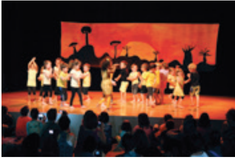
Spectacle de la fête de l'école

L'année scolaire se termine et avec elle notre première année de TAP qui s'est globalement bien passée malgré les difficultés inhérentes à toute période de mise en place, de démarrage. Nous avons fait au mieux pour les enfants qui sont satisfaits. Ils ont découverts différentes activités, tennis, radio, boules, danse, arts plastiques, échecs, cirque, jardinage... Qu'ils ont très apprécié ou un peu moins, suivant les centres d'intérêt de chacun, aucune activité ne pouvant faire l'unanimité.