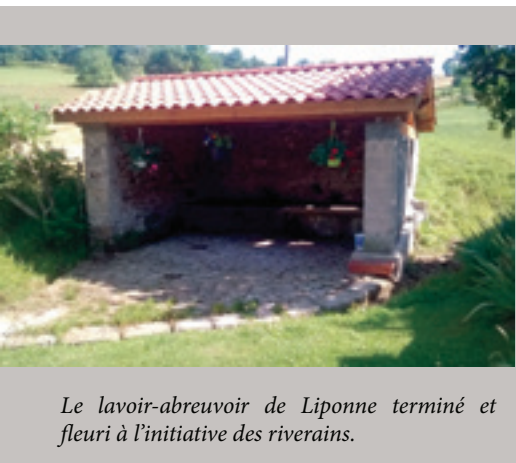
Le lavoir-abreuvoir de Liponne terminé et fleuri à l'initiative des riverains.

- De nombreux exemplaires d'un tract anonyme dénonçant certaines associations du village sans les nommer ont été jetés dans les rues le matin du dernier vide-grenier. Cette façon de faire a été dénoncée par de nombreux conseillers d'une part par son côté anonyme, d'autre part par son côté délateur rappelant de sombres moments... Et enfin parce que nos employés municipaux ont bien assez à faire pour assurer la propreté des espaces publics.