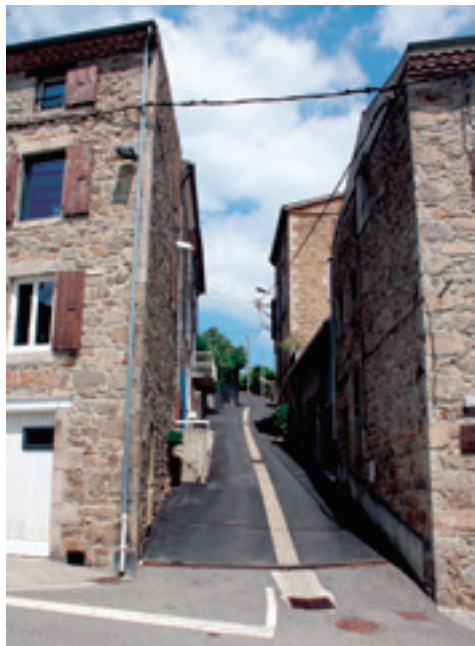
Goudronnage rue du Plateau Marchand.

– La rue du Mas a revêtu un nouveau tapis de 65 tonnes d'enrobé et surtout un embellissement important avec la réalisation de l'enfouissement des réseaux secs (EDF, France-Télécom) et la disparition des anciens poteaux. Le chantier a représenté une somme de 151 423 € dont 36 365 € à la charge de la commune.