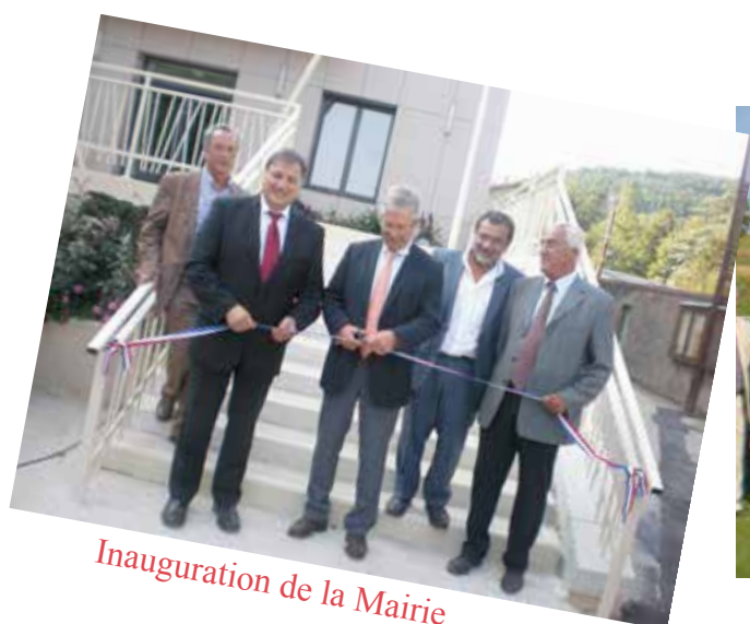
Inauguration de la Mairie