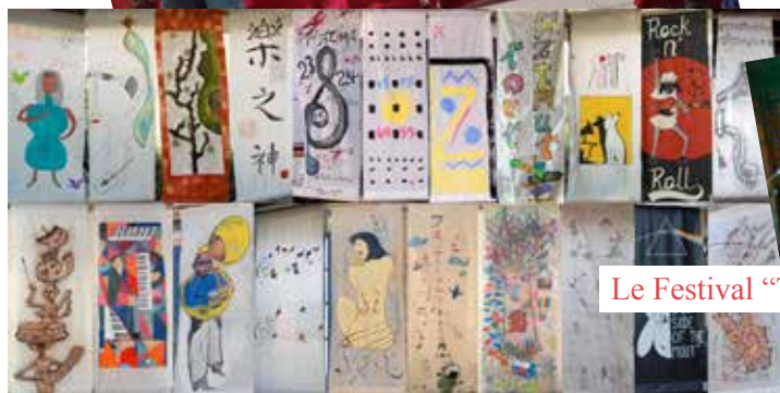
Le Festival "Tout Azimut"

Déco du festival : l'Oreille est Hardie et l'expo In&Off se sont rejoints pour la création de kakemonos tout azimut, un grand bravo à tous les participants !