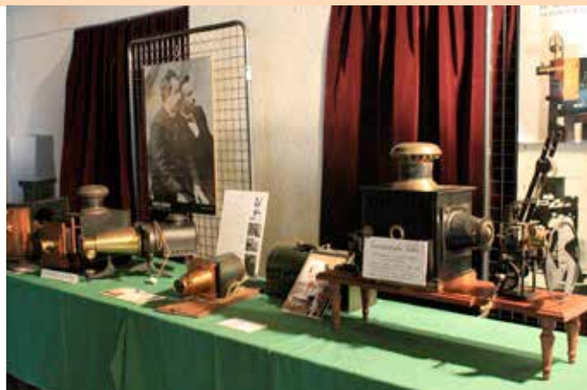
Premiers projecteurs cinématographiques