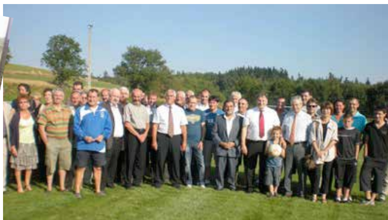
Inauguration du terrain de foot