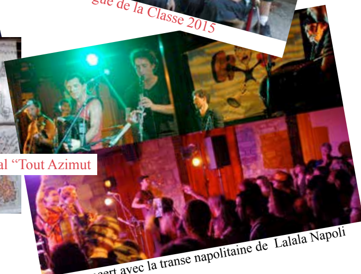
Soirée concert avec la transe napolitaine de Lalala Napoli

Déco du festival : l'Oreille est Hardie et l'expo In&Off se sont rejoints pour la création de kakemonos tout azimut, un grand bravo à tous les participants !