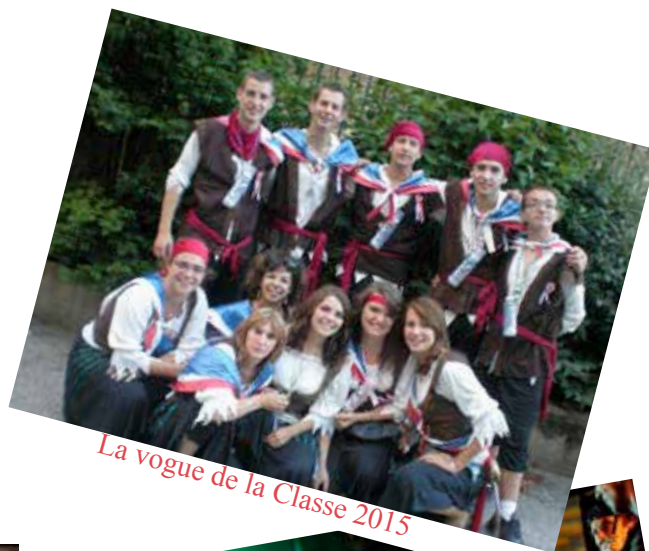
La vogue de la Classe 2015