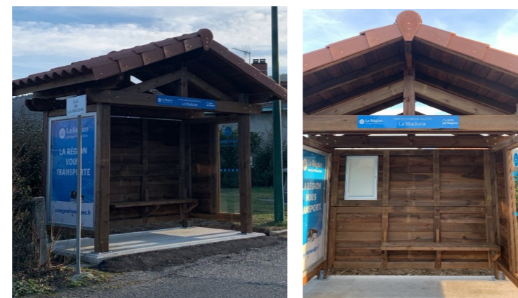
Imprimé par Domcom. Ne pas jeter sur la voie publique.

Merci aux services techniques pour la préparation du chantier, les collégien-nes et lycéen-nes peuvent patienter, protégé-es des aléas météorologiques !